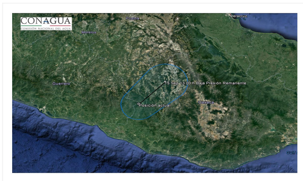
Trayectoria pronóstico de la baja presión remanente de MAX del Pacífico